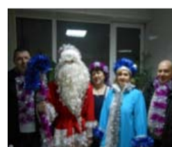
Производственная база «Мыхпай» (склад №1015), обособленного подразделения Нижневартовск АО «РН-Снабжение»