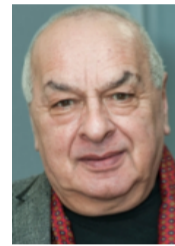
Левон Оганезов, Председатель жюри, Народный артист России, пианист и композитор:

«Больше всего нам понравился сам концерт. А еще нас поселили в очень красивой гостинице, и можно было спокойно репетировать».