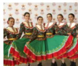
Хореографический ансамбль «Юность», ученики РН-класса г.Губкинский школы №4, «Хореография. Народный танец». 13–17 лет:

«Мы участвуем в Фестивале уже не первый год, и каждый раз что-то меняется к лучшему. Сама поездка на финал — праздник. Москва такая красивая, к нам очень приветливо относились, не смотря на то, что конкуренция высокая. Мы выступаем на Гала концерте — это уже победа!».